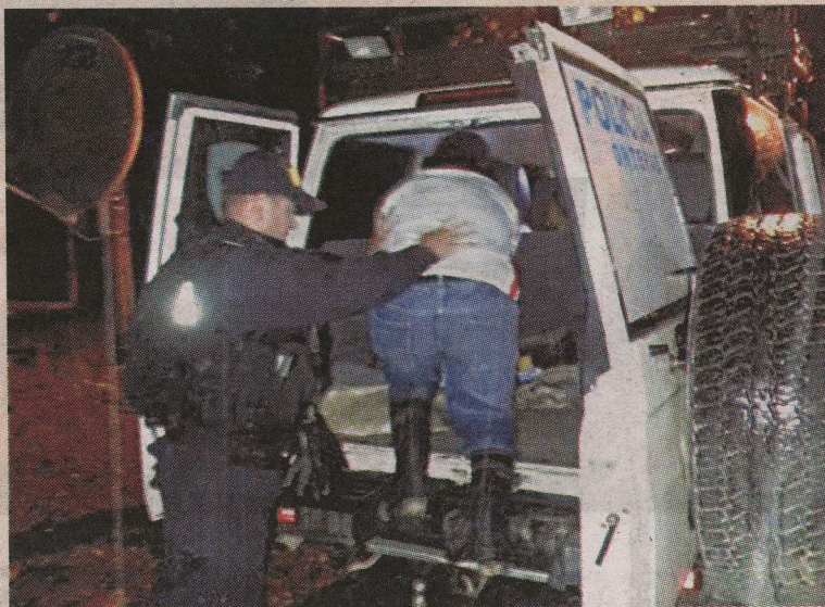
Al detenido lo llevaron a la Fiscalía de Pococí. MSP

Lo reconocieron. Una pareja de oficiales que vigilaba la zona